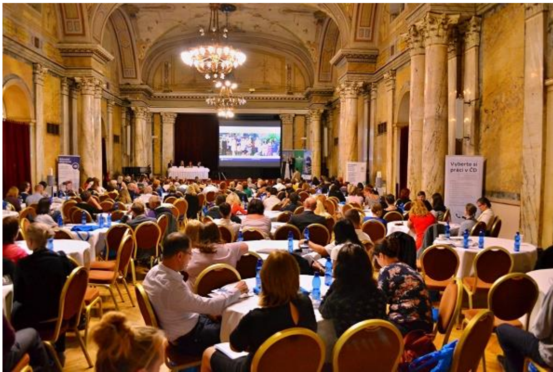
Foto č. 1: XXXIV. Kongres pracovního lékařství, Mariánské Lázně 23.9.2020